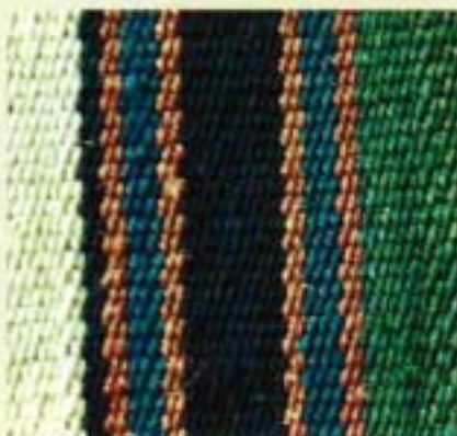
Reps de chaîne