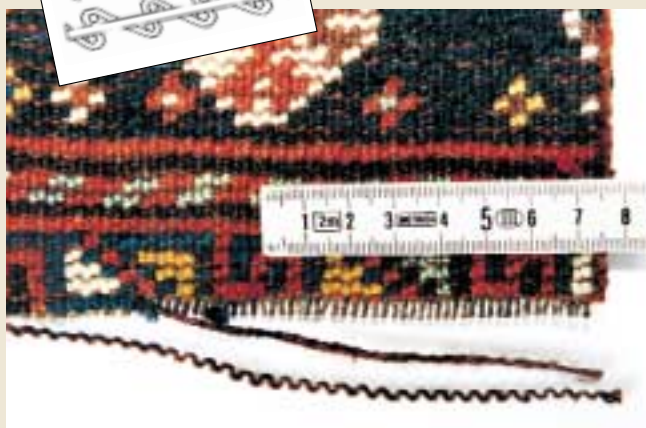
As 1: les deux boucles visibles forment un noeud. Finesse: 25 x 30 noeuds sur 100 cm2 correspondent à 75 000 noeuds au m2.