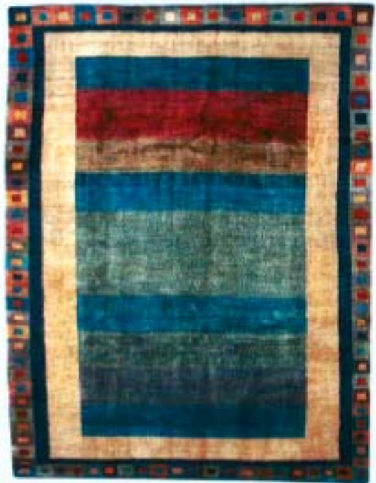
Gashgouli, 205 x 272 cm Gashgouli, 200 x 271 cm Gashgouli, 197 x 247 cm