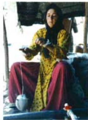
Femme nomade filant

Cela leur laisse toute latitude pour improviser. Le jeu des couleurs confère du caractère à ces tapis. Les tons de base sont des jaunes lumineux, des bleus profonds ou des rouges éclatants. On observe aussi des surfaces chinées. La noueuse prend deux brins de couleurs différentes et les noue ensemble. Par exemple, si elle mélange