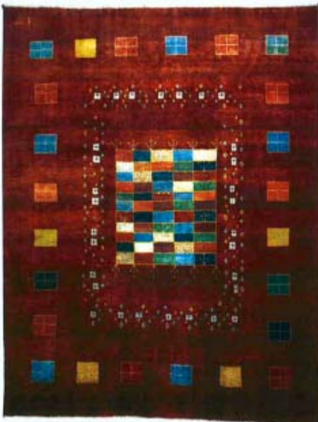
Gashgouli, 144 x 191 cm