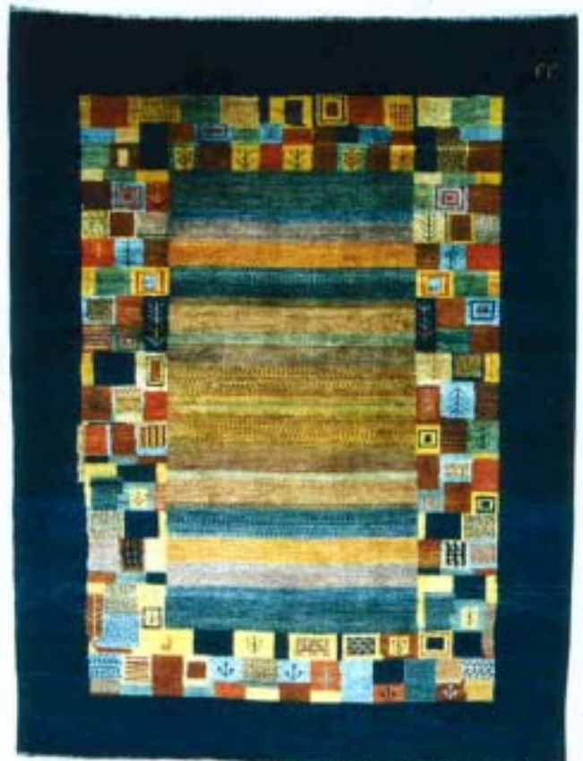
Gashgouli, 115 x 174 cm