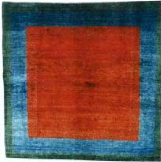
Gashgouli, 200 x 202 cm Gashgouli, 120 x 120 cm Gashgouli, 128 x 148 cm