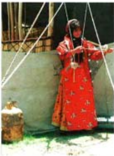
Femme nomade en train de retordre le fil

de 600 x 200 cm sous une tente et y disposent mets et boissons. Notre repas terminé, après le thé, quelques bouffées de narghilé et une promenade digestive nous pouvons enfin poser nos questions et aborder le sujet qui nous intéresse.