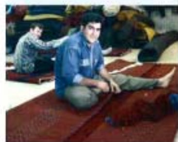
Atelier de réparation, raser, améliorer les bords