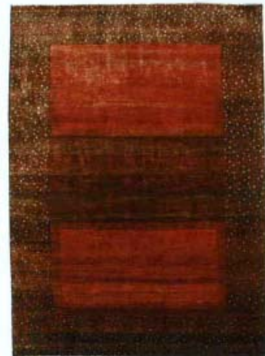
Gashgouli, 170 x 238 cm Gashgouli, 119 x 175 cm Gashgouli, 200 x 294 cm