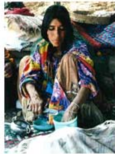
Nomade Kashgāi en train de casser du sucre

Ce tapis se trouve dans le commerce sous différentes dénominations ou orthographe : Gabeh Baseri, Kashgouli, Kash-gouli et Louribaf